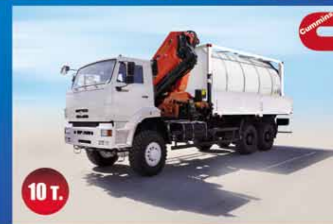
КАМАЗ-6522-10 т. НА ПЕРЕДНИЙ МОСТ

АВТОМОБИЛИ КАМАЗ: +7(8552) 52-78-90, ЗАПАСНЫЕ ЧАСТИ: +7(8552) 53-44-43 БЕСПЛАТНАЯ ГОРЯЧАЯ ЛИНИЯ: 8 800-200-53-30