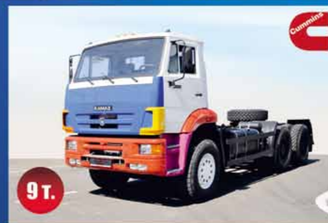
КАМАЗ-6520-9 т. НА ПЕРЕДНЮЮ ОСЬ

МОДЕРНИЗИРОВАННЫЕ ШАССИ-НОСИТЕЛИ ДЛЯ ТЯЖЕЛЫХ СПЕЦИАЛЬНЫХ НАДСТРОЕК