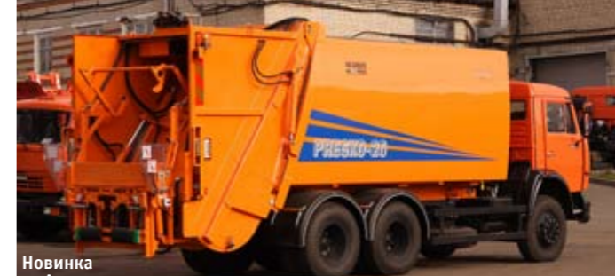
Новинка от Арзамаскоммаша – чешская установка фирмы KOBIT вместимостью 20 м 3

Снижение эксплуатационных расходов при работе мусоровоза с задней загрузкой с передвижными контейнерами достигается за счет исключения маневрирования машины на площадке, ускорения погрузки и снижения износа рабочих узлов автомобиля, так как бак здесь под-