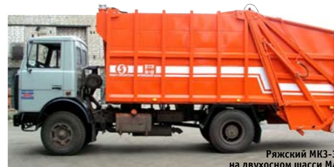
Рязский МКЗ-35 на двухосном шасси МАЗ

ленный ГК «РГ» на шасси МАЗ. В Rotopress загрузочный бункер конической формы подает мусор по шнекам во вращающийся цилиндрический кузов, по винтовым ребрам которого ТБО перемещаются к передней стенке, где дополнительно разрушаются режущими кромками. Это позволяет и повысить итоговую степень уплотнения, и пригодится при работе с сортированными отходами, отправляемыми в переработку, так как проводится их первичное измельчение. Выгрузка осуществляется вращением кузова в обратном направлении при поднятом заднем борте. Для механизированной погрузки встраивается кантователь Zoeller. Сама конструкция обеспечивает защиту мусоровоза от поломок, а масса надстройки меньше, чем у аналогов с прессующей плитой. Сразу три российские компании занимаются монтажом такого оборудования: арзамасский «Коммаш», «РГ-техно» и московский «Коммаш», можно найти его и на вторичном рынке, но даже у подержанной «чудо-машины» цена