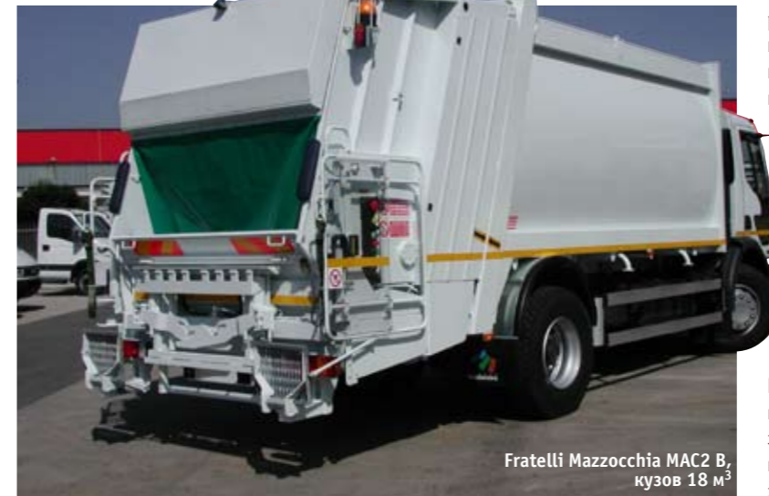
Fratelli Mazzocchia MAC2 B, кузов 18 м 3