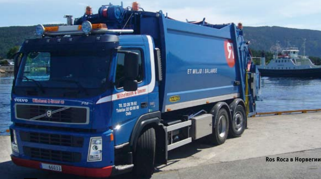
Ros Roca в Норвегии