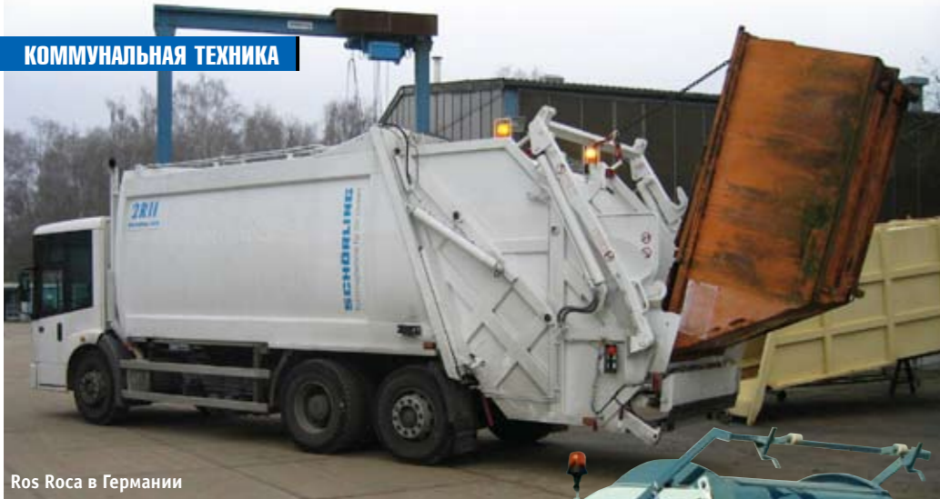
Ros Roca в Германии

потенциальному потребителю доступные варианты кузова и подходящие для него типы шасси. Тем не менее определенные предпочтения складываются, да и сами дистрибьюторы пытаются активнее продвигать отдельные конкретные модели. Так, ЗАО «Коминвест-АКМТ» широко практикует монтаж установок серии T1 на шасси МАЗ и КамАЗ, а в компании «РГ-техно» в 2008 г. сертифицировали вообще все серии мусоровозов на европейских шасси Scania, Volvo, Mercedes-Benz и др.