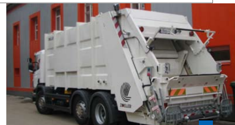
февраль 2010 / Основные Средства